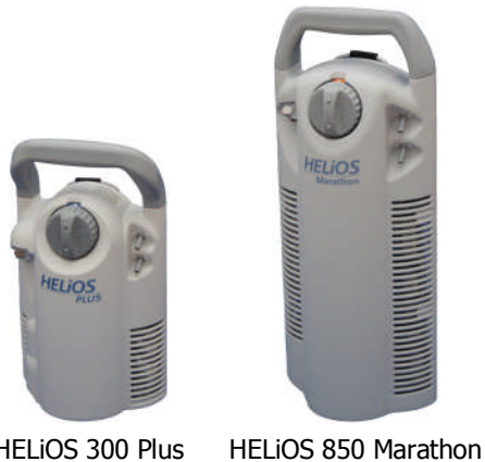
HELIOS 300 Plus