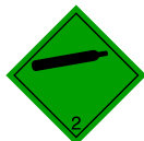
Etiquette 2.2 : Gaz non inflammable et non toxique.