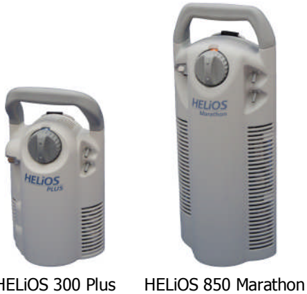
HELIOS 300 Plus