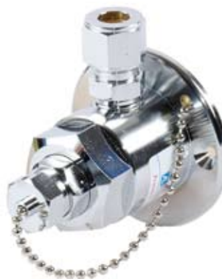
ELC15 RG R

Gasentnahmestelle im Niederdruckbereich mit seitlichem oder zentralem Anschluss für verschiedene Montagemöglichkeiten mit integriertem selbstschliessendem Ventil.